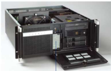
易于维护的系统风扇&可重复使用的过滤器